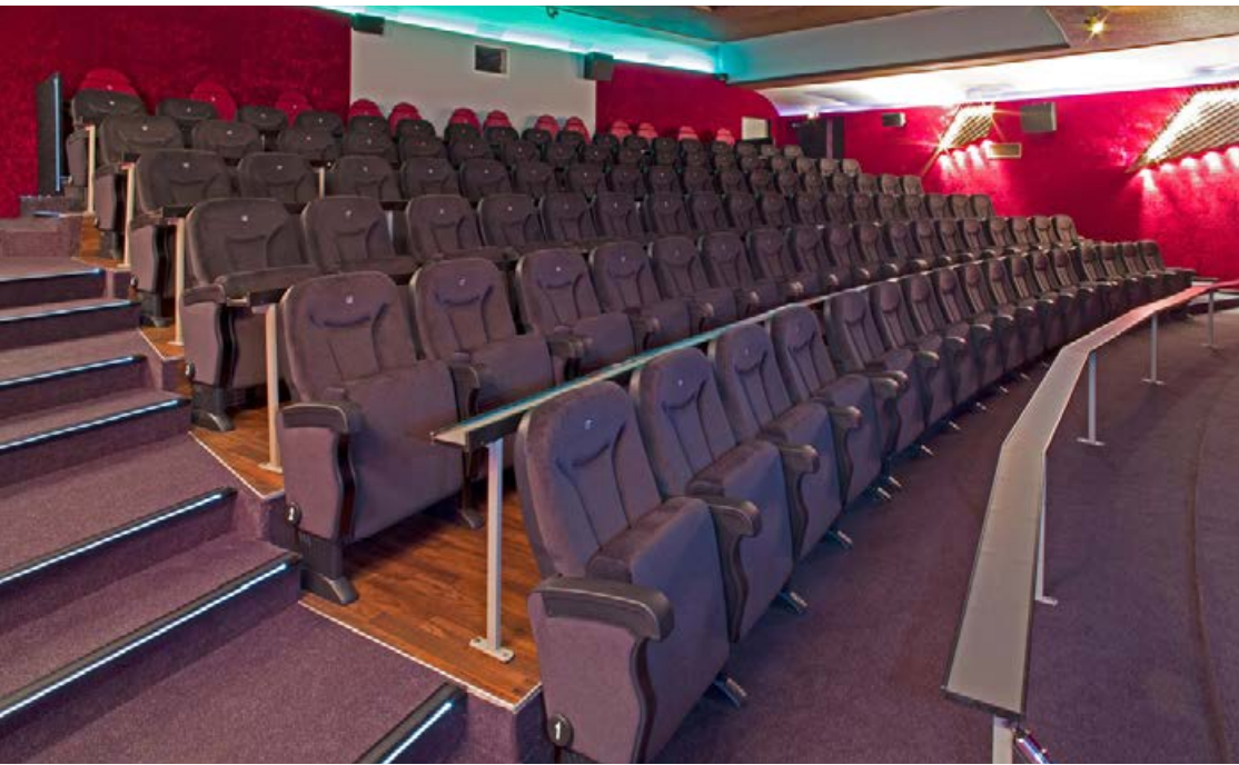
Filmpalast Nienburg. GERMANY